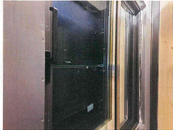
단열성 - 항온실측 사진