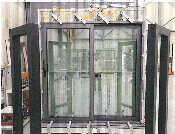
기밀성 - 정면 사진