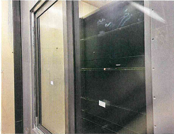
단열성 - 저온실측 사진