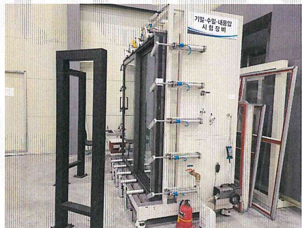
기밀성 - 측면 사진